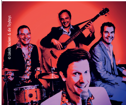
© Jakob Nacken & die Toyboys